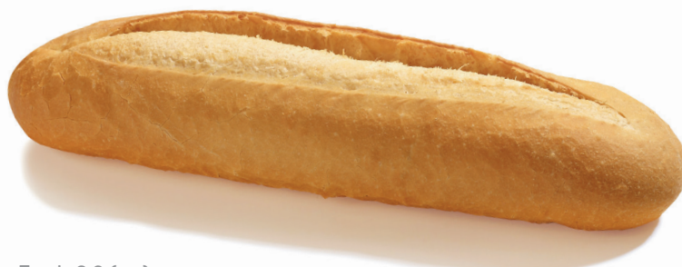
Escala 2:3 (cm)